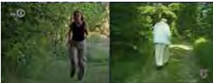
104, 105 Geert Mul stills uit SN.X4 2008/Generatieve installatie met 4 monitoren